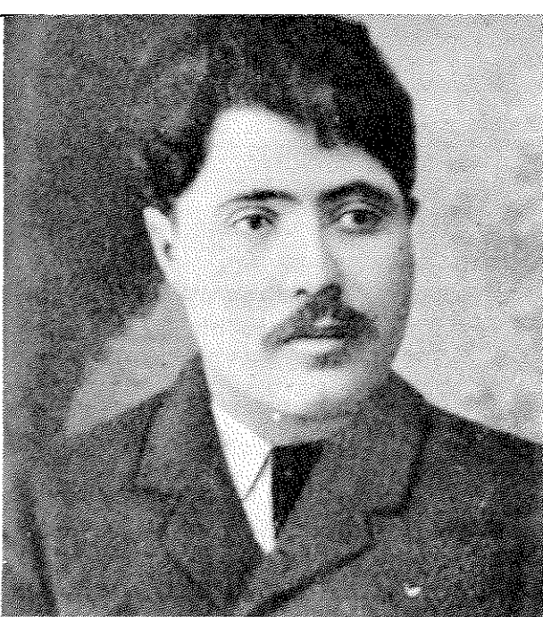
יוסף חיים ברנר תקף בחריפות את עתונות הסנסציה

כאן עצר ברנר משטף זעמו, ותמה אם יש בכלל ערך לביקורתו: